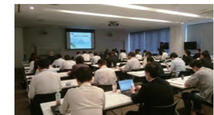
第3回食品産業生産性向上 フォーラムの様子